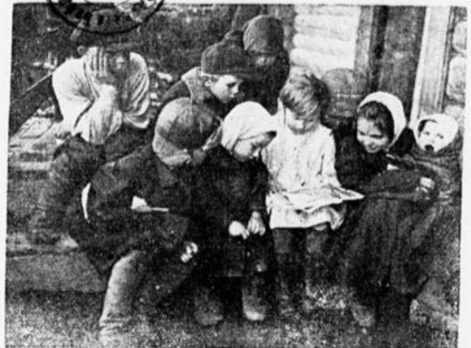
...„Ишь как ладно“.

Ветер о землю ивы гни, На тоску не сетуй! Веселей искривись дни, Вы в стране Советов.